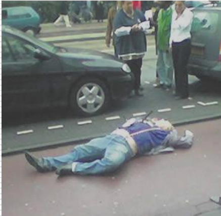
Theo van Gogh